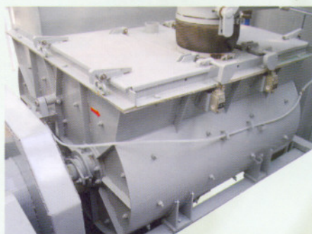
Смеситель двухвальный оригинальной конструкции с лопатками специальной формы.

Дозирование инертных материалов и цемента обеспечивается тензометрическими системами с высокой точностью. Вода подается в смеситель через расходомер. Точность и быстрота дозирования воды обеспечивается применением двух электромагнитных клапанов различного проходного сечения. Смешивание компонентов происходит в двухвальном смесителе. Конфигурация лопаток обеспечивает высокое качество перемешивания и низкую потребляемую мощность смесителя.